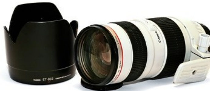
Canon EF 70-200mm f/2,8 L