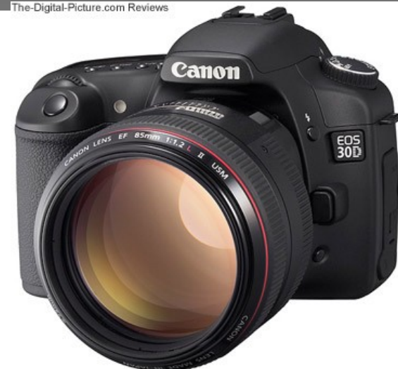
Canon EF 85mm f/1,2, The Digital Picture