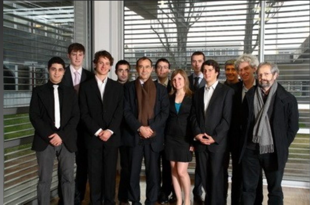
Acteurs des relations avec les entreprises, ECL Quelques problèmes d'éclairage...