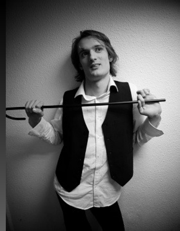
▲ Steren, de près et au grand angle (équivalent 24mm)