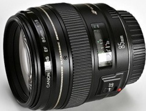
Canon EF 85mm f/1,8